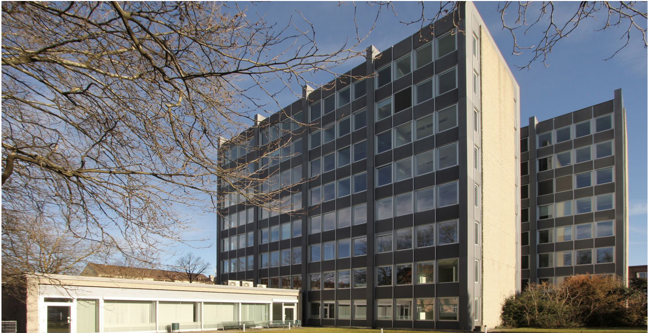
[81] Flexi-Heim: Außenansicht | © Hess/Talhof/Kusmierz Architekten