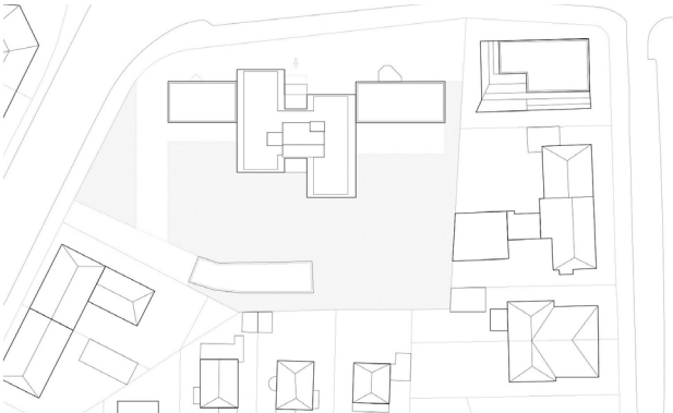
[82] Flexi-Heim: Lageplan | © Hess/Talhof/Kusmierz Architekten